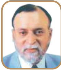
अनील बैजल 11.06.12 तक