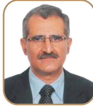
डी.एस.डेसी अध्यक्ष एवं प्रबंध निदेशक 08.10.12 से